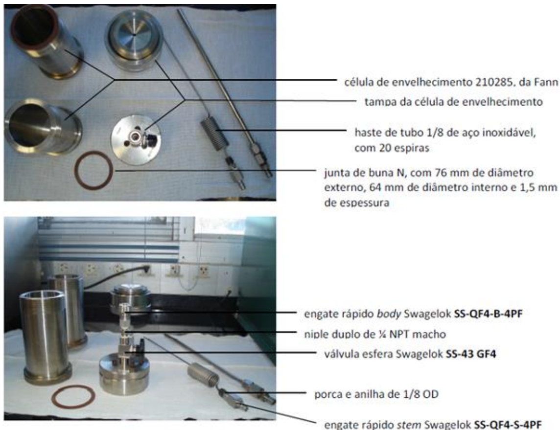
Figura 1 – Exemplo e aspecto dos materiais utilizados no conjunto para a compressão do petróleo.

Preparar uma solução contendo 30% (v/v) do óleo de silicone de 100 cSt (Sigma-Aldrich) em querosene. Essa solução tem validade de 7 dias se conservada em frasco âmbar e temperatura ambiente.