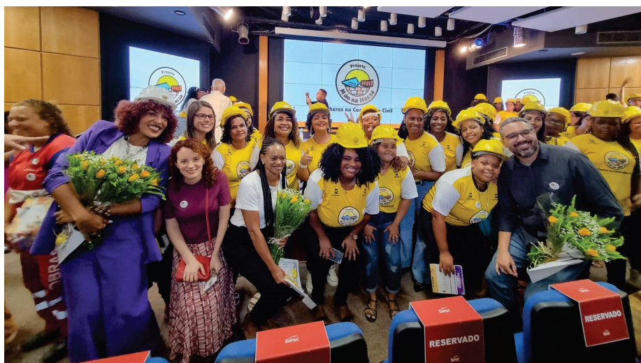
Alegria das formandas do Mão na Massa.

O projeto Mão na Massa está sempre relacionado a profissões da construção civil e pretende contribuir para o desenvolvimento de competências profissionais, gerando trabalho e renda.