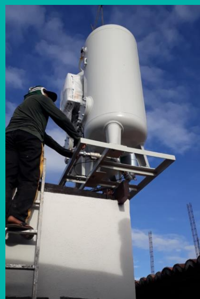
Instalação da microusina

No início de junho, foram entregues as duas primeiras microusinas de produção de oxigênio para os estados do Ceará e Rio Grande do Sul. A previsão é de que comecem a operar em cerca de 40 dias.