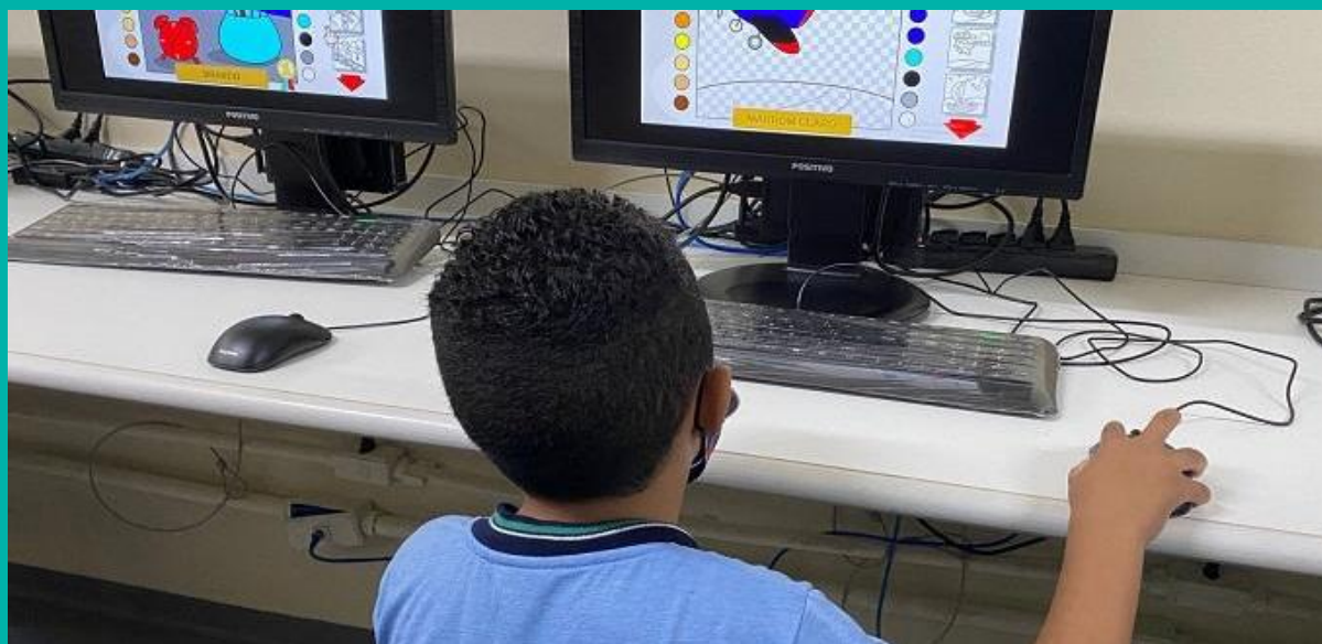
Projeto Janelas para o Amanhã visa aprimorar o uso da tecnologia digital na prática pedagógica

Um futuro com mais oportunidades passa pela inclusão digital. E queremos, na prática, contribuir para que jovens de nossa região possam se preparar melhor para o futuro. Apostando nisso, estamos realizando o projeto Janelas para o Amanhã, que vai doar cerca de 2.300 computadores para escolas públicas municipais e estaduais no estado de São Paulo, localizadas próximas a algumas de nossas unidades.