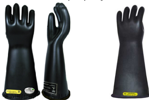
Luvas isolantes – Modelos ilustrativos

Luva fabricada em elastômero e utilizada para proteção do trabalhador à choque elétrico (IEC 60903)